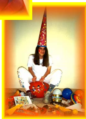
[Toy-Musicus 1, 2 & 3; The Funfare]